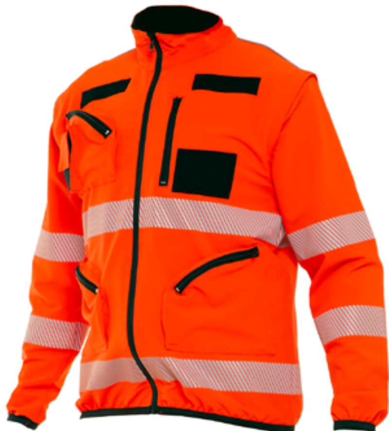
BC133 03 Giacca Elasticizzata Alta Visibilità