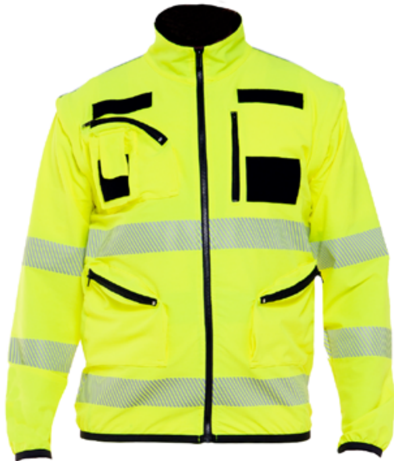
BC133 06 Giacca Elasticizzata Alta Visibilità