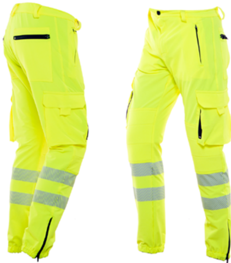
BC132 06 Pantalone Elasticizzato Alta Visibilità