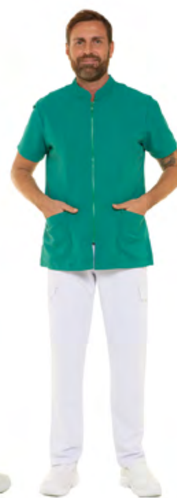
09 - Verde