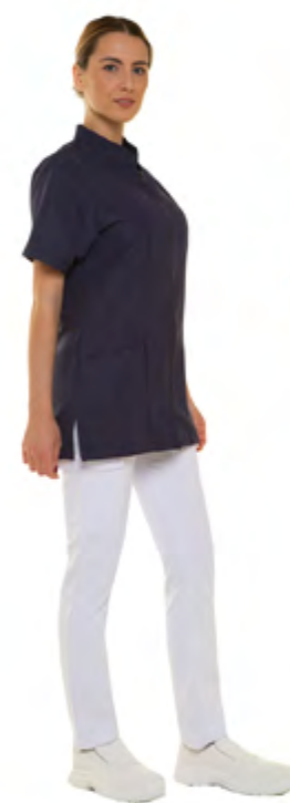
08 - Nero