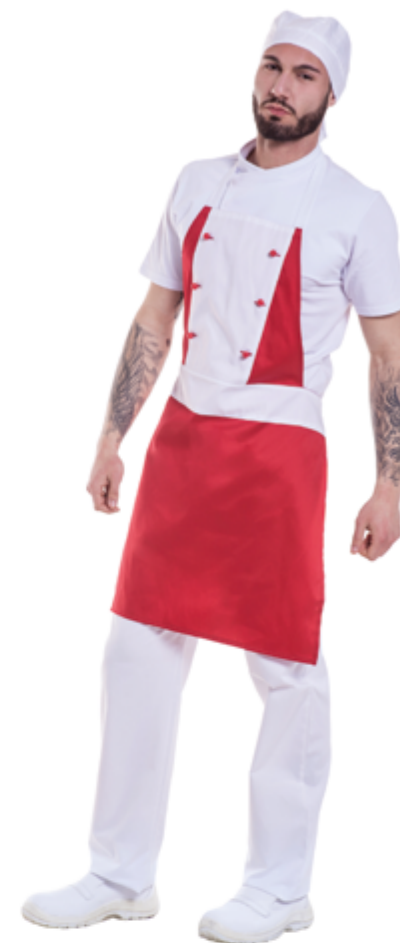
E002 Grembiule Pizzaiolo Unisex

Fascia in vita rinforzata e 2 lacci lunghi da cm 125 6 bottoni antipanico 65% poliestere - 35% Cotone da 170 gr. mq Non restringe e scolora al lavaggio Prodotto certificato OEKO-TEX Lavabile a 60 gradi Produzione Italia - Marca: Chef Italy