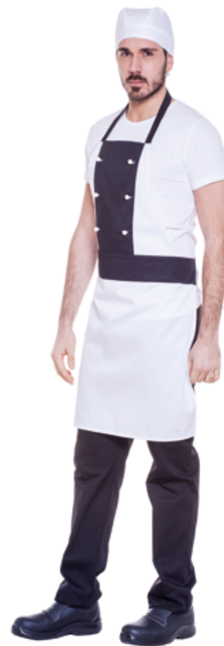
E001 Grembiule Pizzaiolo Unisex